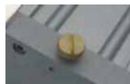
Sistema de desbloqueo