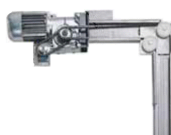
Transmisión de cadena