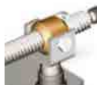
Sinfin de acero con tuerca en bronce