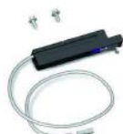
Final de carrera cierre