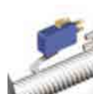
Final de carrera apertura