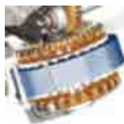
Motor 230 V