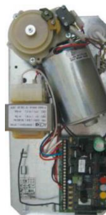
Ajuste manual de los finales de carrera.