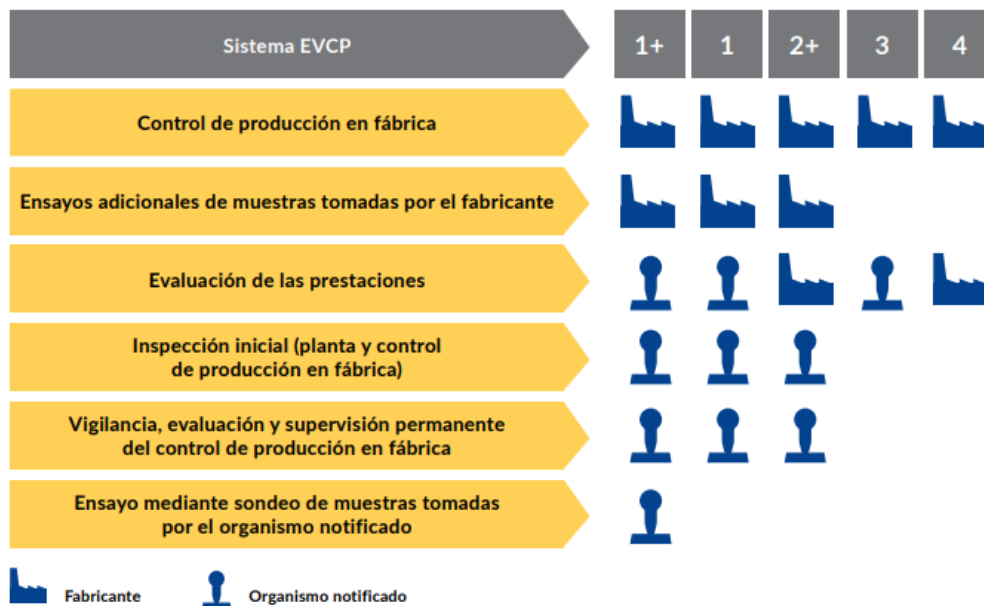
Imagen: esquema del funcionamiento de los diferentes sistemas EVCP existentes en el RPC. Obtenido del documento "MERCADO CE DE LOS PRODUCTOS DE CONSTRUCCIÓN PASO A PASO".

En este caso, en función del uso previsto del producto (ver Anexo ZA de la norma armonizada), el fabricante deberá usar el sistema 1 o el sistema 3 (o el sistema 4 de manera excepcional, según artículo 37 RPC):