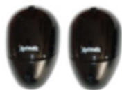
Fotocélula ER 10