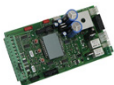
Cuadro BT40 DG