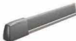
Banda de cable