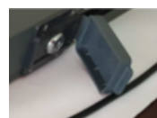
Desbloqueo a llave