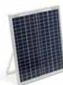
Panel Solar SOLARPOWER XUNZEL 20W 24V con 4 m cable pre-instalado