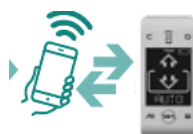
T-NCF Interface protocolo NFC