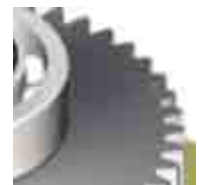
Corona de acero