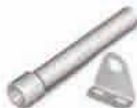
Tubos de torsión