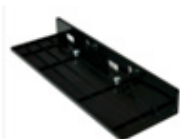
Ángulo a techo